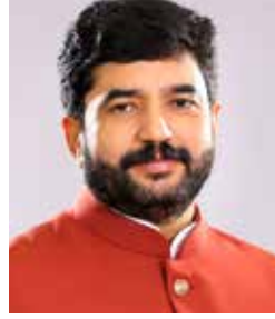
केंद्रीय सहकार राज्यमंत्री मुरलीधर मोहोळ

सहकार क्षेत्रात तरुण व्यावसायिक तयार करण्याची मूळ कल्पना त्रिभुवनदास यांची होती. या उद्देशाने हे विद्यापीठ स्थापन करण्यात आले आहे. असे नमूद करून ते म्हणाले, त्रिभुवनदास यांनी खऱ्या अर्थाने सहकाराचा पाया घातला होता, ज्यामुळे गुजरातमधील ३६ लाख महिला व्यवसाय करत आहेत. पॅक्स म्हणजेच प्राथमिक कृषी पतसंस्था, सीएससी, मायक्रो एटीएम, हर घर नल, बँक मित्र आणि सुमारे