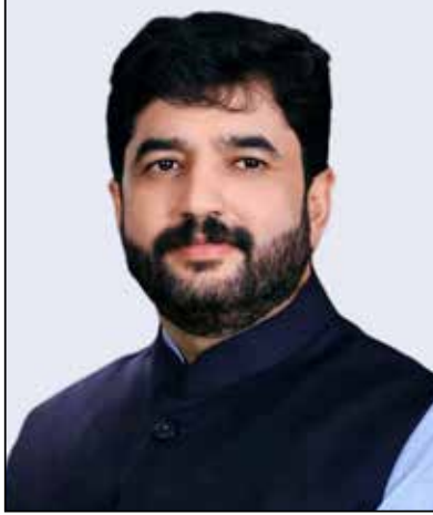
केंद्रीय सहकार राज्यमंत्री मुरलीधर मोहोळ

‘राष्ट्रीय सहकार धोरण २०२५’ हे वर्ष २०४७ मध्ये विकसित भारत बनण्याच्या दिशेने टाकलेले एक दमदार पाऊल आहे. या धोरणामुळे सहकार क्षेत्राच्या क्षमतेचा पूर्ण वापर देशासाठी होणार आहे. यातून सहकार क्षेत्र हे भारताच्या अर्थव्यवस्थेचा मजबूत आधारस्तंभ बनणार आहे.