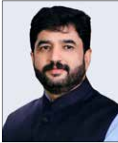
केंद्रीय सहकार राज्यमंत्री मुरलीधर मोहोळ

देशातील आठ लाख सहकारी समित्यांपैकी सव्वा दोन लाख समित्या महाराष्ट्रात आहेत. देशाच्या सहकार क्षेत्रात महाराष्ट्र आघाडीवर आहे. एनसीईएल, एनसीओएल, बीबीएसएसएल या संस्थांच्या माध्यमातून महाराष्ट्रात मोठा विस्तार होत आहे. 'एनसीईएल' आणि 'एनसीओएल' मध्ये राज्यातील अनुक्रमे अकराशे आणि तीनशेहून अधिक सहकारी संस्था सामील असून, बीबीएसएसएलशी पाच हजारांहून अधिक संस्था जोडल्या गेल्या आहेत, असे ते म्हणाले.