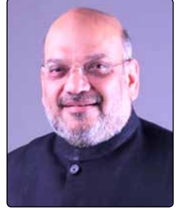
केंद्रीय सहकार मंत्री अमित शाह