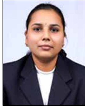
वैजंतीमाला केंद्र संशोधन अधिकारी, वंमनिकॉम, पुणे