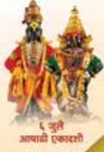
६ जुलै आषाढी एकादशी