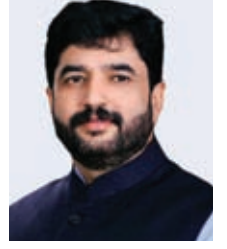
केंद्रीय मंत्री मुरलीधर मोहोळ

आठ लाखांपेक्षा अधिक सहकारी संस्था असून त्यात ३० कोटीपेक्षा अधिक सदस्य आहेत. नव विद्यापीठाच्या माध्यमातून नवीन उद्योग आणि नवनिर्मितीला चालना मिळणार आहे. केंद्रातील सरकार राष्ट्रीय सहकार धोरण लवकरच आणणार आहे, असेही त्यांनी सांगितले. नुकत्याच सादर करण्यात आलेल्या अर्थसंकल्पात ११९० कोटी रुपयांची तरतूद करण्यात आली आहे. गेल्या साडेतीन वर्षांत सहकार मंत्रालयाने अभूतपूर्व काम केले आहे. सहकार मंत्रालयाने नव्याने २ लाख नवे पॅक्स स्थापन करण्याचे उद्दीष्ट ठेवले आहे. त्यातील १४ हजार स्थापन झाले आहेत, अशी माहिती त्यांनी सांगितली.