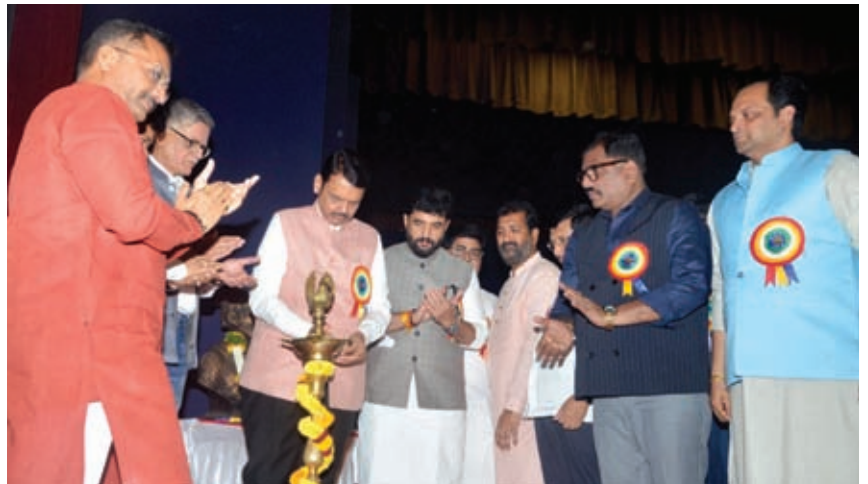
मुख्यमंत्री देवेंद्र फडणवीस दीपप्रज्वलन करताना मध्यभागी केंद्रीय सहकार राज्यमंत्री मुरलीधर मोहोळ व अन्य पदाधिकारी