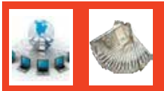
कोअर बँकींग आर्टीजीएस ऑड एनईएफटी

IMPS सुविधा (मोबाईलद्वारे 24x7) 365 दिवस पैसे ट्रान्सफर करण्याची जलद सुविधा