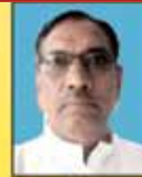
कृष्णा वि. राजत संचालक